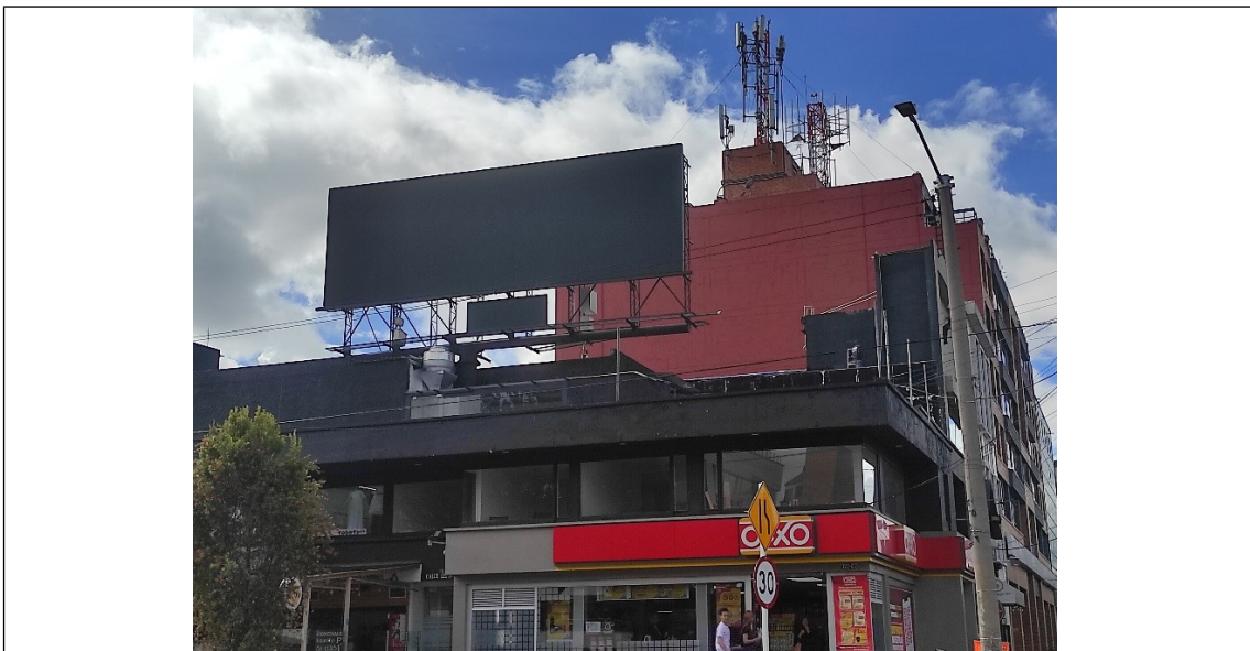
Foto 2. Vista con orientación Sur – Norte de la estructura de la valla, en buenas condiciones y estable.